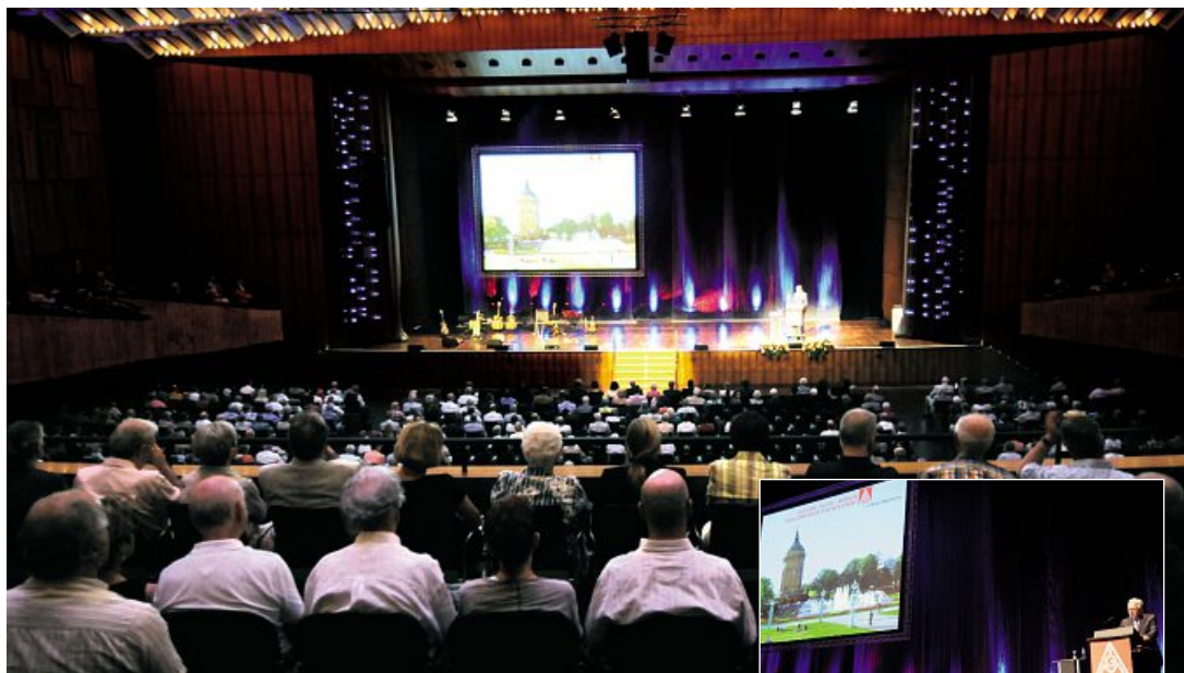
1400 Jubilarinnen und Jubilare waren der Einladung der IG Metall Mannheim zur Jubilarehrung in den Rosengarten gefolgt.