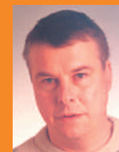
Urban Selzer Betriebsratsvorsitzender EMA Indutec GmbH, Meckesheim

„Mit Unterstützung der IG Metall ist es uns gelungen in die Tarifbindung zurückzukehren und verlässliche Arbeitsbedingungen wieder herzustellen.“